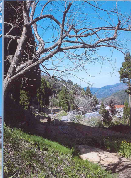
やわらかな春風に草木が目覚める