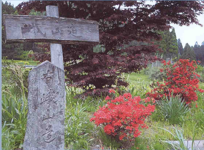
キリシマが咲く峨山道