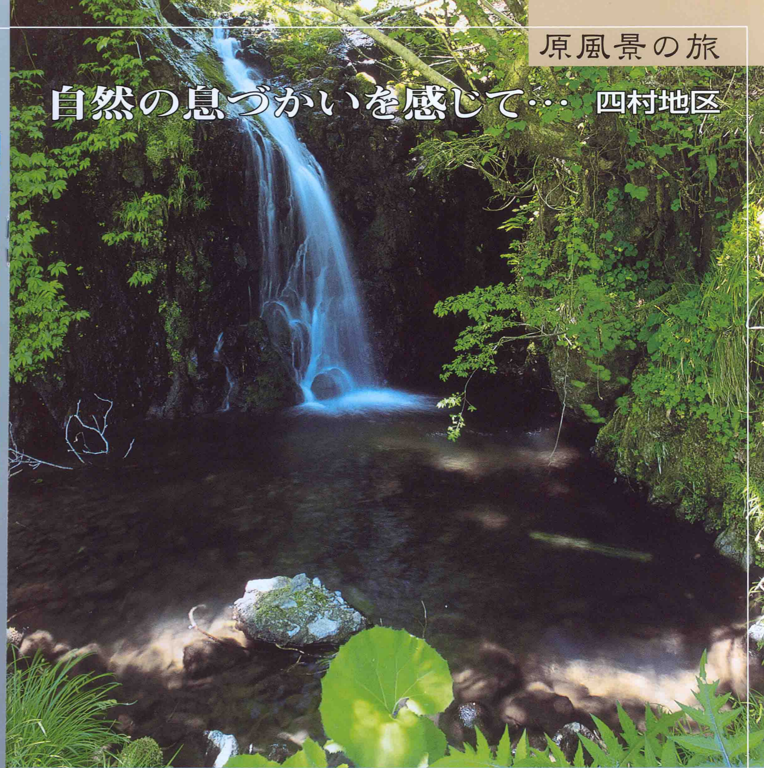
清らかな水が流れ落ちる滝谷滝

穴水町の西部、八ヶ川の水源地域に、北に大角間、南に越渡、東に桂谷、西の台地上中の四つの集落が集まっているのが四村地区。一帯は周囲を山に囲まれた谷間になっており、今も茅葺き屋根の民家が残る集落の風景は、懐かしい日本の原風景を思わせる。 かつては林業で栄えた四村地区にはアテを含む自然林が多く、平成元年からその豊かな自然資源を利用した新しい村づくりが進められてきた。テーマは「花と緑と清流の山里」。春から初夏にかけて、各戸こそって栽培したササユリとノトキリシマが競うように色鮮やかな花を開き、みずみずしい新緑に美しく照り映える。 せせらぎの音を澄まして古道をたどれば、路傍に苔むした石標。鎌倉時代に曹洞宗の僧・峨山和尚が羽咋の永光寺から門前の総持寺へ通う道しるべとした峨山道石標で、往時をしるびながら散策するのも趣深い。 かぐわしい花の香りと目にまぶしい木々の緑、そして心を癒すせせらぎの音や野鳥のさえずり、いにしへの歴史の面影。四村地区には、現代社会がどこかに置き忘れてきた深いやすらぎがある。