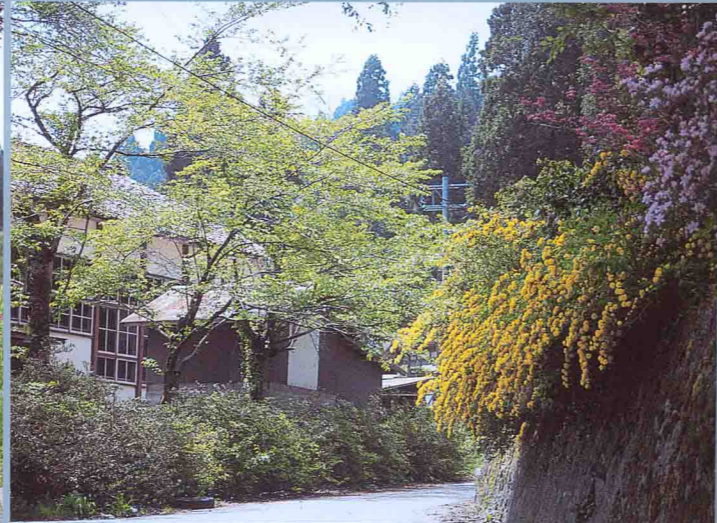
花々が山里に季節を告げる