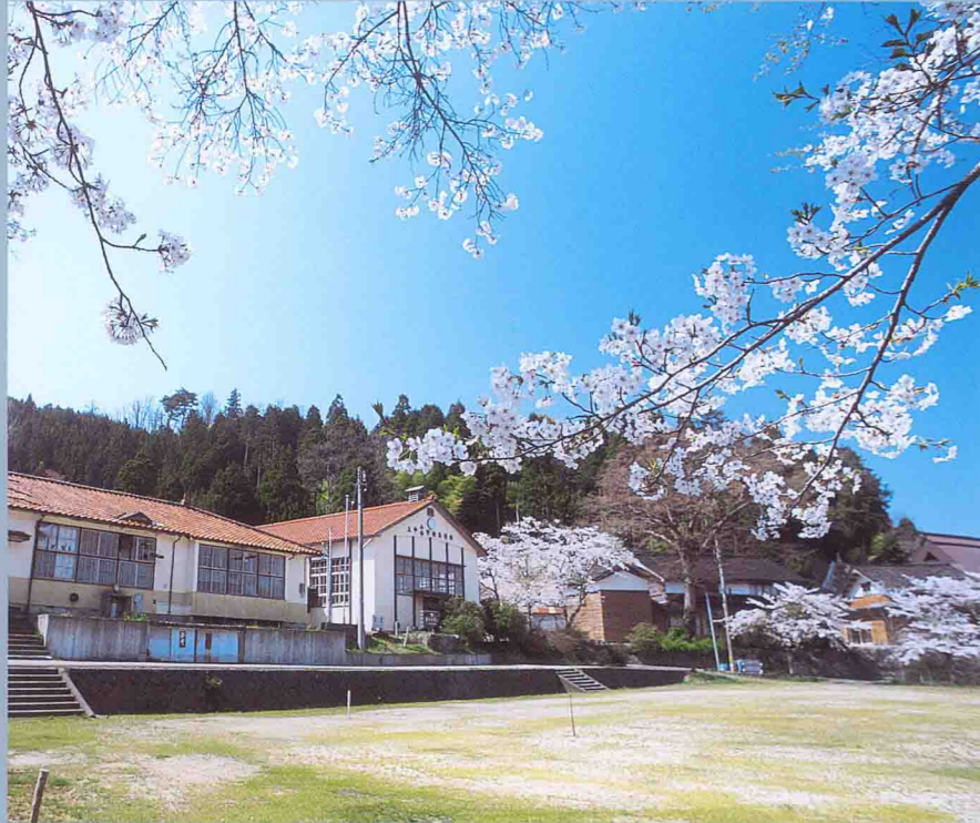
旧上中小学校(平成7年3月閉校)の桜