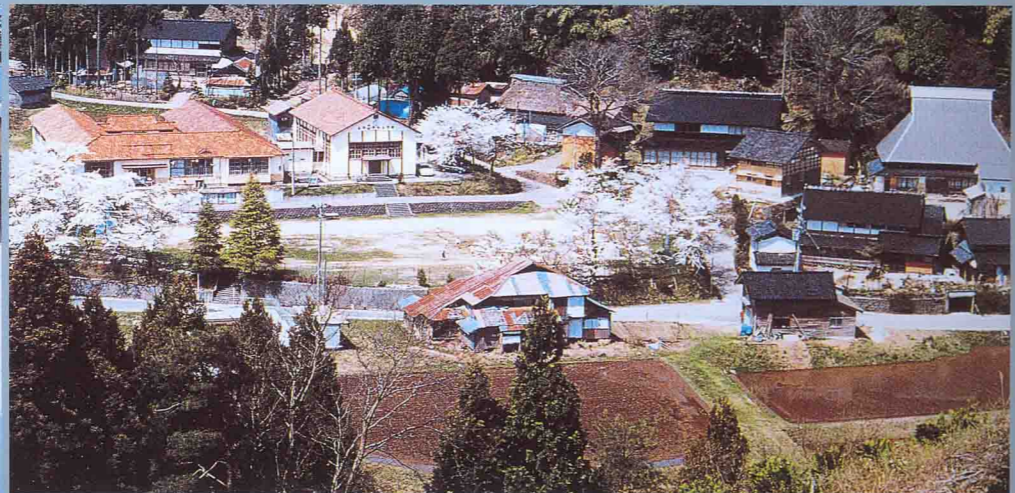
昔ながらの風景が残る上中集落